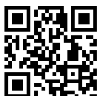
Tavola rotonda 1:

Partecipa alle tavole rotonde rispondendo al questionario